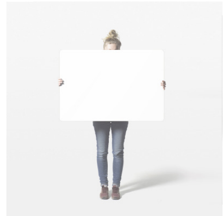
Unser innovativer Ideaframe!

Entdecken Sie unsere Grandstands (2-stufig oder 3-stufig), das Flexiboard, den Teamdesk oder den Ideaframe bei uns im Shop: www.whatifwefly-shop.de