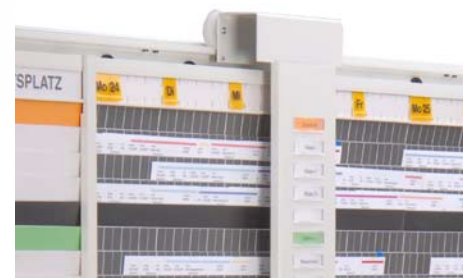
Abb. Hängerahmen mit Termintafel und Terminalschiene

Hängerahmen mit Führung für die Terminalschiene, Lieferung inklusive Montagmaterial